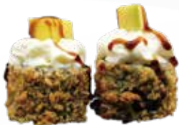
A7 / HOSOMAKI MANGO Mini roll di riso fritti, farciti con salmone guarniti con philadelphia e mango e salsa teriyaki allergeni /1.3.4