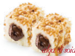
A6 / NUTELLA MAKI Rotoli piccoli di riso farciti con nutella allergeni /6.7.8