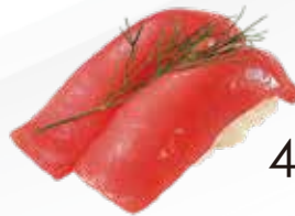
41 / MAGURO Tonno allergeni /4